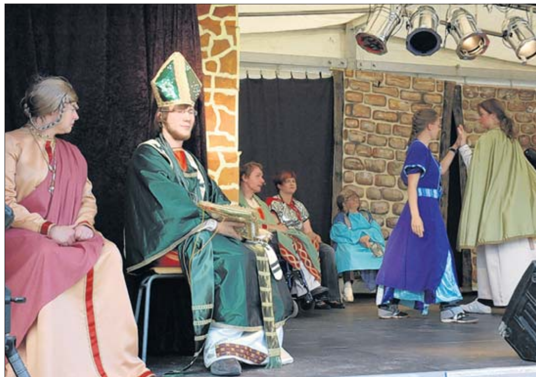
Beim Jahresfest 2009 war natürlich das 1000-jährige Jubiläum ein großes Thema, wurde auf der Bühne die lange Geschichte Wolmirstedts präsentiert.

Am Sonnabendabend findet dann auf der Bühne des oberen Burgberges wieder die Show statt. In welche Kostüme die Mitarbeiter und Fachschüler schlüpfen, welche Stars Wolmirstedt besuchen werden, das wird momentan noch nicht verraten. Schließlich gibt es unter den Dächern der Stadt genug Platz für Überraschungen.