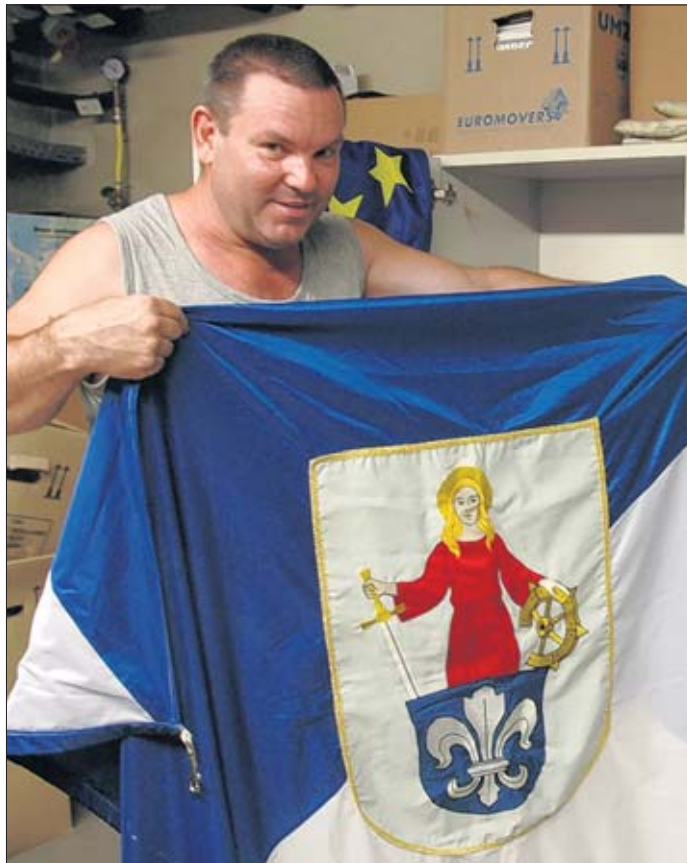
Im Flaggenschrank, der sich im Keller des Rathauses befindet, lagert neben den Fahnen von Europa, Bundesrepublik und Land natürlich auch die für Wolmirstedt.

Der Trauerflor, der heute gehisst wurde, sagt dagegen aus, dass auch in Wolmirstedt der Opfer der Katastrophe von Duisburg gedacht wird.